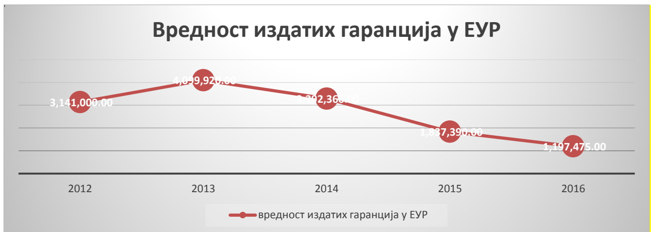
Графикон 2.2. приказује вредности издатих гаранција у периоду 2011. – 2016. година у ЕУР-има.

Полазећи од чињенице да је Фонд посебно ангажован у области пољопривреде, на смањење броја издатих гаранција у овој области у односу на предходне извештајне периоде, утицала је велика конкуренција између банака и лизинг кућа (набавка механизације и опреме путем лизинга), промена аграрне политике која се односи на смањења издвајања државе за подстицаје у пољопривреди (подстицаји за пољопривредну производњу на површини до 20 хектара, регреси за гориво, ђубриво,