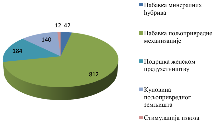
Слика 2. Графички приказ броја издатих гаранција по наменама