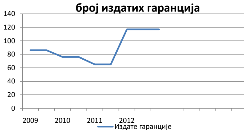
Слика 1. Број издатих гаранција у периоду 2009. – 2012. година

На Слици 1., приказан је упоредни преглед издатих гаранција у у периоду 2009. – 2012. година